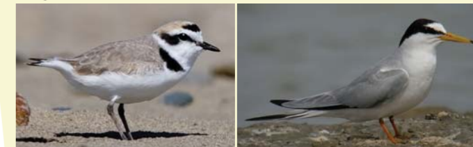
Gravelot à collier interrompu

L'île aux oiseaux est un site majeur de reproduction de goélands leucophés dans la région. Des sternes naines et des gravelots à collier interrompu, deux espèces protégées aux effectifs en déclin, nichent également sur un banc de sable situé au sud du spot. Les échasses blanches nichent quant à elles dans la végétation de salicorne qui borde l'étang.